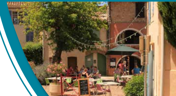
Page 11 : Votre été au Thoronet