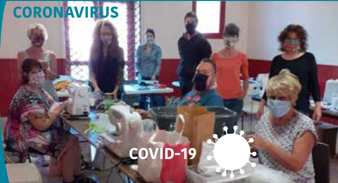
Page 6 : Dossier Spécial Covid 19