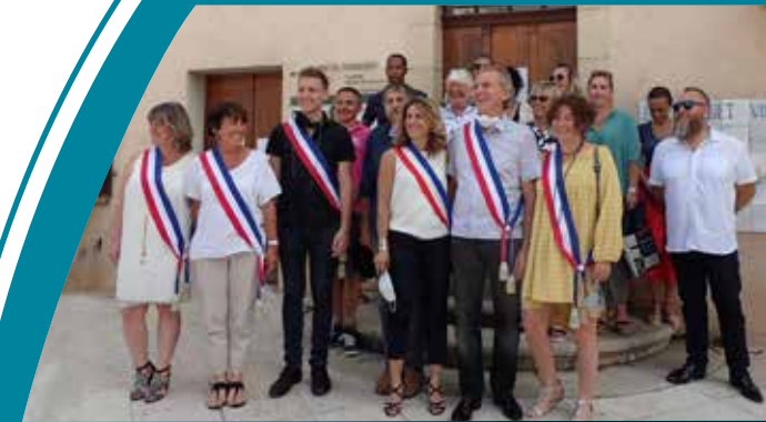
Page 4 : Votre nouveau conseil municipal