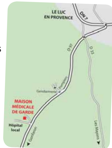
Carte d'accès à la Maison Médicale de Garde.