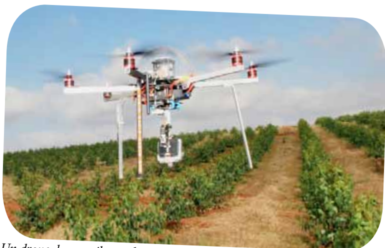
Un drone de surveillance des feux de forêt, équipé d'une caméra.