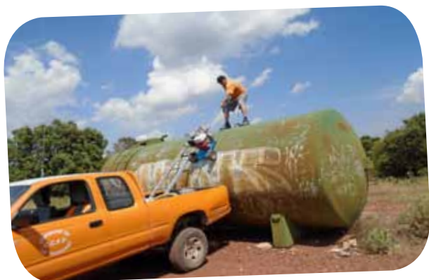
Le nettoyage de la cuve TRT9 endommagée intentionnellement.

Chers amis, nous vous demandons de respecter les infrastructures incendie. Ces dernières sauvent des vies et un jour en aurez vous peut-être besoin pour vous, ou votre famille. De plus, les pompiers risquent leurs vies pour sauver les nôtres. Détériorer les outils mis à leur disposition pour mener à bien leur mission présente un risque supplémentaire pour eux, comme pour nous tous.